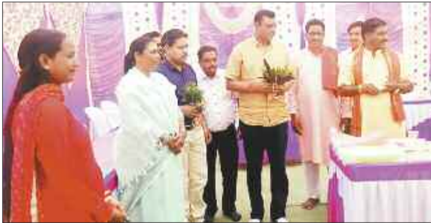
रामनवमी महोत्सव में शामिल विधायक गोमती व अन्य।