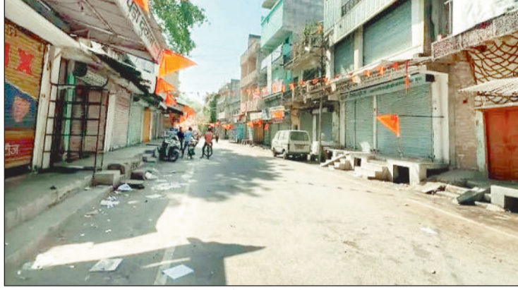
नगर बंद के दौरान सारंगढ़ के बाजार में दुकानों पर लगे ताले, पसरा सन्नाटा।