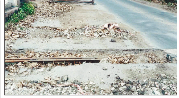
जर्जर पुल से बाहर झांक रहा सरिया।

रायगढ़। लोकसभा निर्वाचन 2024 के लिए भारत निर्वाचन आयोग द्वारा नागरिकों के निर्वाचन उल्लंघन से संबंधित शिकायतों के त्वरित कार्रवाई के लिए सी विजिल एप सिटिजन विजिल एप देश में चालू है। आचार संहिता के उल्लंघन के मामलों में नागरिकों की सहभागिता बढ़ाने एवं शिकायतों के त्वरित निराकरण के लिए भारत निर्वाचन आयोग द्वारा निर्मित सी विजिल एप्लीकेशन को और भी सशक्त बनाया गया है। अब आम नागरिक आचार संहिता उल्लंघन के मामलों की शिकायत लाइव फोटोग्राफ एवं वीडियो के साथ साथ ऑडियो क्लिप के माध्यम से भी कर सकेंगे। यदि कोई नागरिक राज्य में आचार संहिता उल्लंघन की कोई घटना देखता है तो सी विजिल एप्लीकेशन का उपयोग करते हुए घटनास्थल की एक फोटो या 2 मिनट की वीडियो या ऑडियो क्लिपिंग बनाकर एप्लीकेशन के माध्यम से शिकायत कर सकता है।