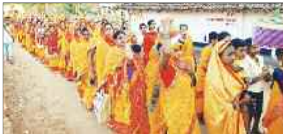
कलश यात्रा में शामिल महिलाएं।

बड़ी संख्या में लोग शामिल होकर श्री राम प्रभु की जयकारा लगाते दिखे। रामनवमी महोत्सव के अवसर पर यहां के गरियादोहर में भव्य कलश यात्रा निकाली गई, जिसमें बड़ी संख्या में महिला पुरुष शामिल हुए। इस अवसर पर महकुल समाज द्वारा कलश बली मंदिर प्रांगण में अष्ट प्रहरी अखंड कीर्तन का आयोजन किया गया। झांडे लेकर मंदिर प्रांगण से निकाली गई कलश यात्रा मुख्य बस्ती होकर मैनी नदी तट पहुंची, वहां से वैदिक मंत्र उच्चारण कर कलश में पवित्र जल भर कर पुनः