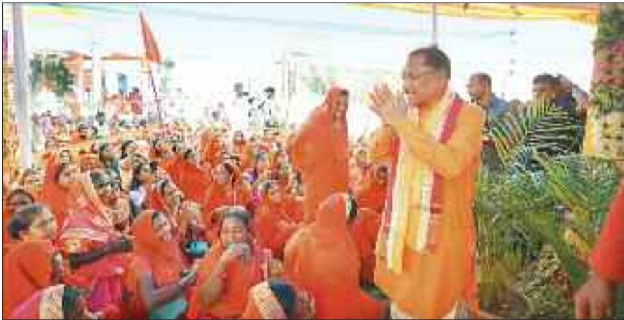
बगिया में महायज्ञ के समापन मौके पर उपस्थित मुख्यमंत्री साय।