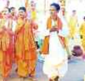
कलश यात्रा में शामिल महिलाएं।

बड़ी संख्या में लोग शामिल होकर श्री राम प्रभु की जयकारा लगाते दिखे। रामनवमी महोत्सव के अवसर पर यहां के गरियादोहर में भव्य कलश यात्रा निकाली गई, जिसमें बड़ी संख्या में महिला पुरुष शामिल हुए। इस अवसर पर महकुल समाज द्वारा कलश बली मंदिर प्रांगण में अष्ट प्रहरी अखंड कीर्तन का आयोजन किया गया। झांडे लेकर मंदिर प्रांगण से निकाली गई कलश यात्रा मुख्य बस्ती होकर मैनी नदी तट पहुंची, वहां से वैदिक मंत्र उच्चारण कर कलश में पवित्र जल भर कर पुनः