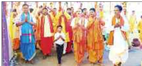
जय श्रीराम का नारा लगाते श्रद्धालु।