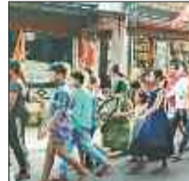
रैली में शामिल बच्चे।

जशपुरनगर। नारायणपुर में रामनवमी की शोभा यात्रा धूमधाम व भव्य तरीके से निकली गई। जुलूस में जय जय श्री राम व जय जय हनुमान के नारों से नारायणपुर गुंजाता रहा। रामनवमी में राम भक्तों ने काफी जोश के साथ इस वर्ष कुछ नया कर दिखाया। चारों ओर जय श्री राम के नारे गुंज रहे थे जुलूस में भारी संख्या में महिलाएं और बच्चे भी हुए शामिल। रामनवमी की शोभा यात्रा पाठ के बाद शाम 5 बजे शिव मंदिर परिसर से निकला गया। इसके बाद शोभा यात्रा कन्या शाला, ग्रामीण बैंक अटल चौक पहुंची। डीजे के धुन में झूमते जय श्रीराम का नारा लगाते बस्ती के मुख्य मार्ग से होकर जय रत्नम चौक पहुंचे वहां भी बजरंग बली के झंडे का विधिवत पूजा किया गया। वहां पूजा अर्चना के बाद नृत्य करते राम भक्त श्री सर्वेश्वरी आश्रम पहुंचकर वहां विधि विधान से पूजा अर्चना किए। नारायणपुर मंडली डीजे की धुन पर लोग झूमते रहे। जुलूस में शामिल लोग राम लखन जानकी जय बोलते हनुमान की, जय श्री राम धार्मिक जयकारा लगाते हुए चल रहे थे लोगों के बीच शरभत व चना का वितरण किया गया। इस जुलूस में गांव के ग्रामीण और भारी संख्या में महिलाओं की उपस्थिति रही।