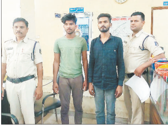
पुलिस गिरफ्त में आरोपी।

गौरतलब है कि बीते कुछ दिनों से लगातार मवेशी तस्करों की धरपकड़ की कार्रवाई यह बताने के लिए काफी है कि रायगढ़ जिला मवेशी तस्करों के लिए सफ कारिडोर बना हुआ है। इस तथ्य को बल तब मिला जब बुधवार को ओडिशा बार्डर पर कोतरलिया से पुलिस ने मवेशी तस्करों से जुड़े