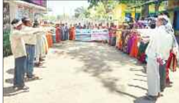
मतदाताओं को शपथ दिलाई गई।

चलाया जा रहा है। विभिन्न ग्राम पंचायतों की सहायता समूह का सहित नगर भ्रमण कर दधिभ्रमण किया जायेगा। एक दूसरे को रंग गुलाल लगाकर कृष्ण की भक्ति में सराबोर होंगे।